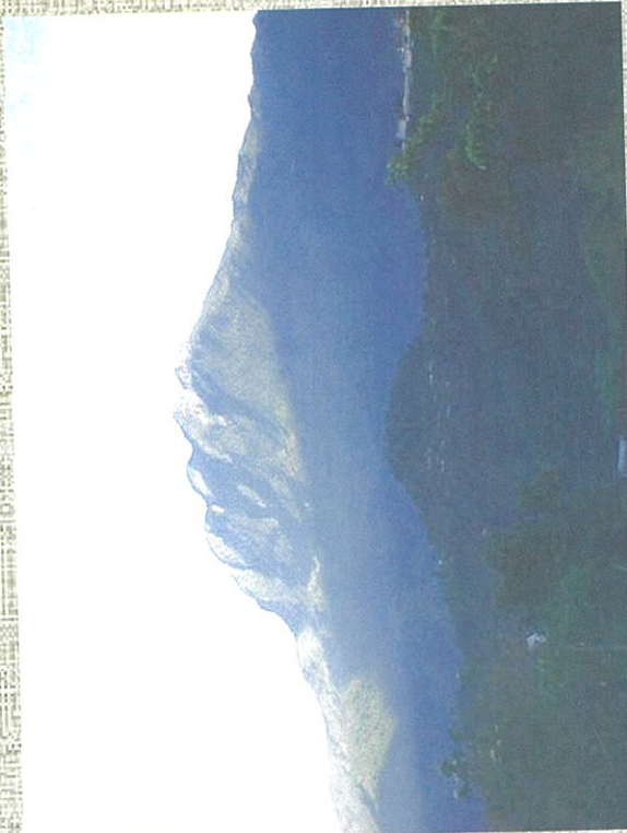
Cerro "La Malinche" Aloteppec Mixe, Oaxaca, México.

Santa María Aloteppec Mixe, Oaxaca. México.