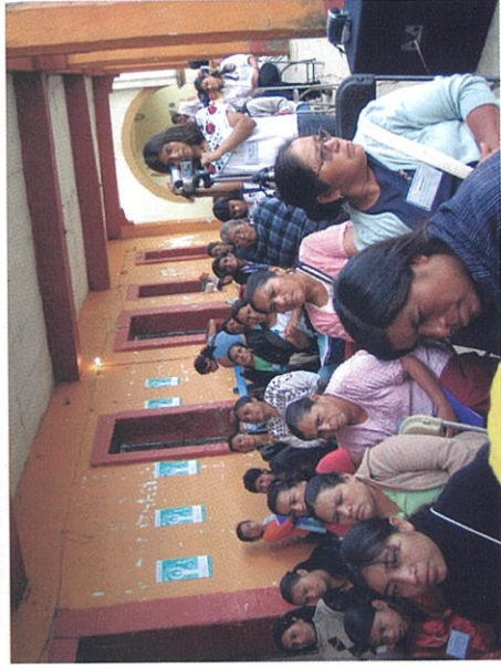
Durante este encuentro las mujeres analizaron y propusieron el caminar de la red.

"... queremos decir que es lo que no nos gusta, que nos atrevamos a decir nó, que nos atrevamos a decir: ¡somos mujeres! y nos sentimos orgullosas, que aprendamos a alzar la mirada y mirar el sol, que aprendamos a compartir también lo que nos duele, lo que no nos gusta lo que nos lastima, aprender a gritar lo que sentimos y aprender a defender nuestros derechos; por que llorar no es malo, llorar nos hace fuertes y nos hace poder caminar con los hombres, con nuestros amigos, con los que nos han golpeado; y que esas heridas nos impulsan a caminar, a hacer estos encuentros, agarrar el micrófono y decirles lo que somos, lo que sentimos y tenemos que seguir luchando por nuestro derechos en nuestras comunidades en nuestra Oaxaca, en nuestro México"